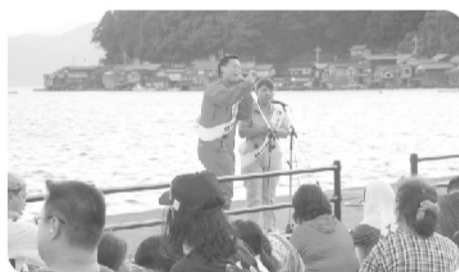
せんりのきゅうによる漫才