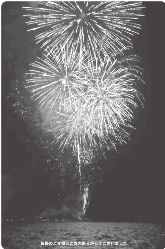
皆様のご支援とご協力ありがとうございました