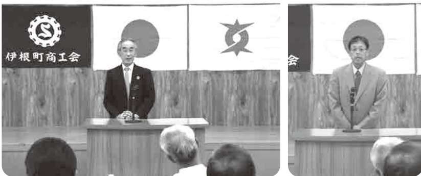
濱野商工会長の開会挨拶